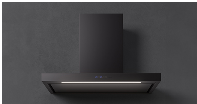
De foto is puur informatief Kan afwijken van de geselecteerde versie.